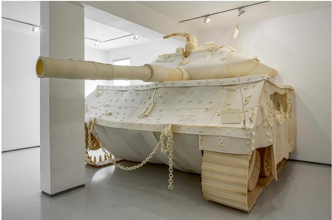
מרכבה, גלריה נגא, תל אביב